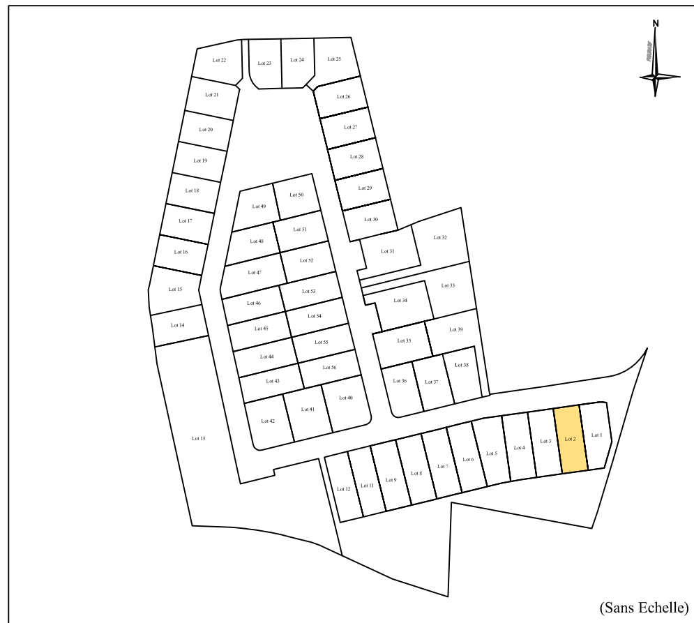
PLAN DE COMPOSITION